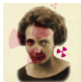
L'escape game " Clairvivre 1940 : mission radium