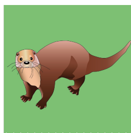
Explorateurs Orgnac-sur- Vézère